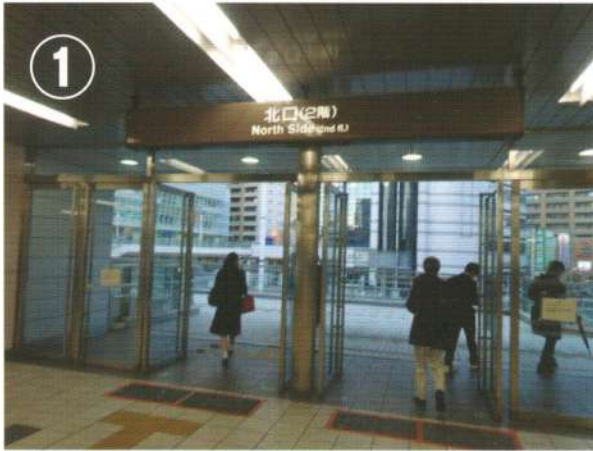
① JR勝川駅北口（2階）から外に出ます。