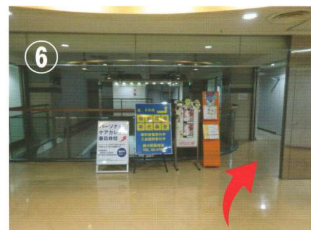
⑥ 右手側の手前から3番目の教室が春日井校でございます。

〒486-0931 愛知県春日井市松新町一丁目4番地 ルネック4F パーソナルケアカレッジ春日井校