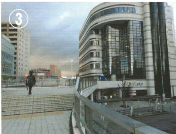
③ しばらくすると右奥にルネックが見えてきます。