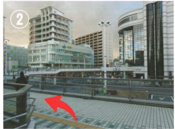
② 出口を出てすぐ左折して道なりに歩きます。