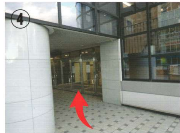
④ 2階の入口から中に入ります。